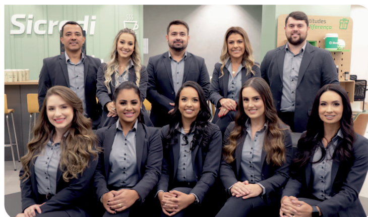
Colaboradores da Agência Muriaé Centro

Com um espaço físico de 500 m², a nova agência combina um espaço físico moderno e aconchegante, com atendimento próximo e humano, que é a marca registrada do Sicredi. O novo espaço se soma à estrutura da Agência Muriaé Barra. Com isso, a partir de hoje, a cidade conta com duas agências do Sicredi, à disposição dos seus associados.