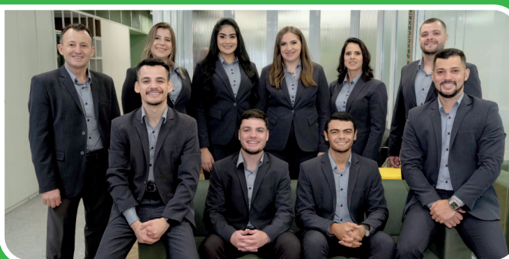
Colaboradores da Base Regional

A Base Regional consiste em uma estrutura que oferece suporte para todas as agências da Cooperativa, em Minas Gerais. Neste espaço de 500 m² atuarão os profissionais responsáveis pelo suporte às agências, abrangendo áreas de negócio através da Assessoria PJ, Assessoria PF, Assessoria Agro, Assessoria de Investimentos, Gestão de Pessoas, Controles Internos e, Comunicação e Marketing . A solenidade de inauguração contou com a presença da direção da Cooperativa, autoridades locais e regionais, associados e comunidade.